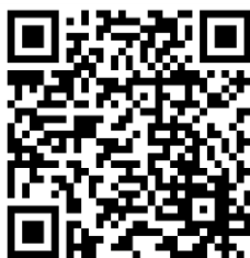
Charte de LPDS

Cette brochure n'est pas exhaustive de l'ensemble des prestations dispensées. Elle a pour but de faciliter votre intégration dès votre arrivée et pour la durée de votre séjour.